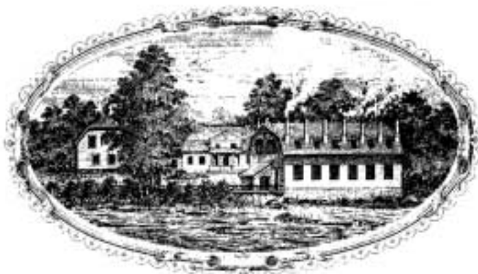
Mölntorps Smidesfabrik på 1870- talet